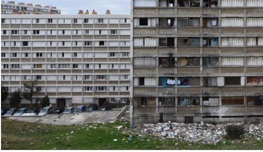
Les quartiers Nord