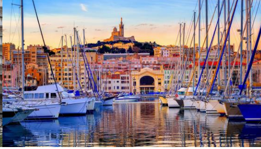
Le Vieux port

1. Laquelle illustre le “côté cramé” ? Laquelle illustre le “côté carte postale” ? Justifiez votre choix.