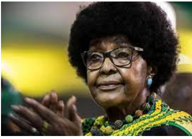
Winnie Mandela – Femme politique