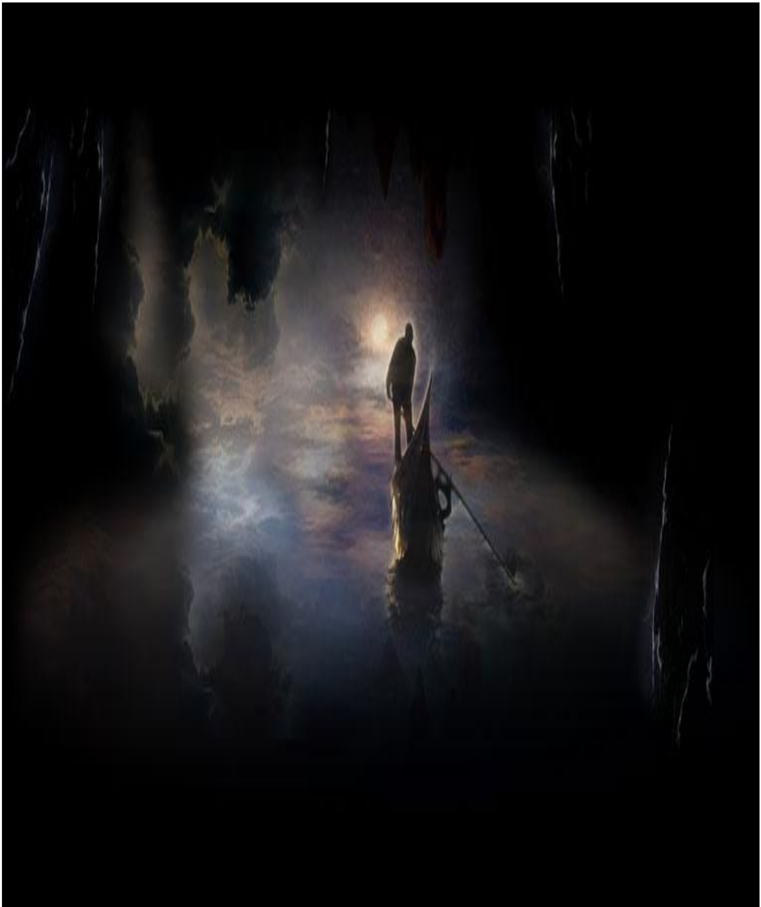
Le Fleuve de l'Oubli