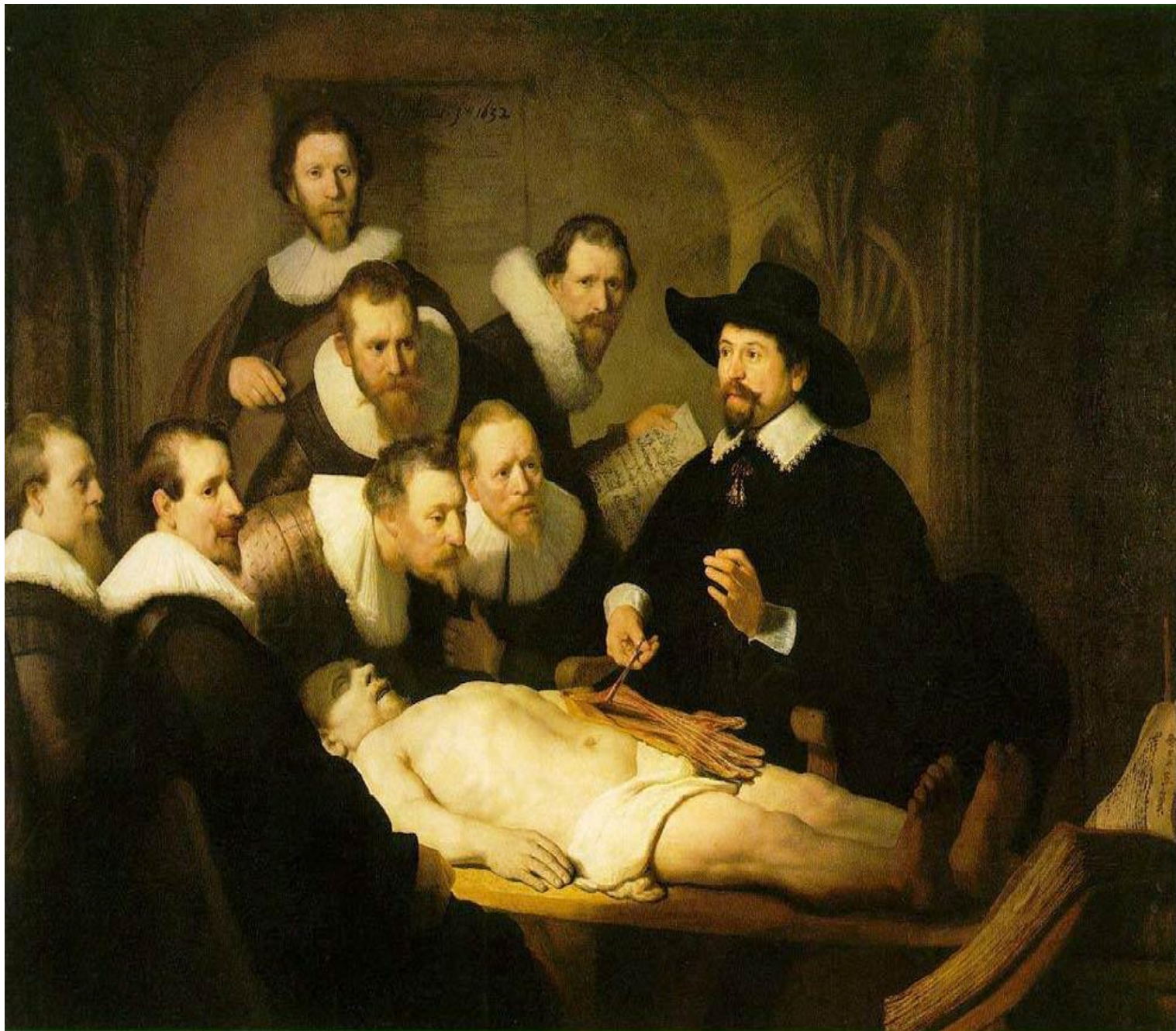
La leçon d'anatomie (REMBRANDT)