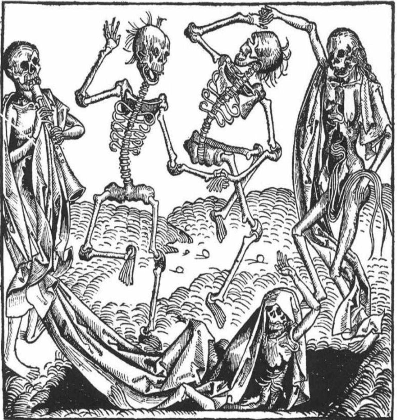
La danse macabre