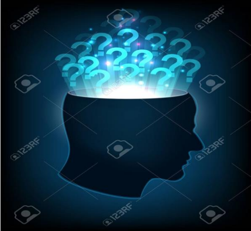
UN ESPRIT HUMAIN

Montrer au TBI les images suivantes et en donner l'explication aux apprenants.