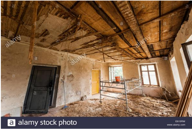
UN PLAFOND POURRI