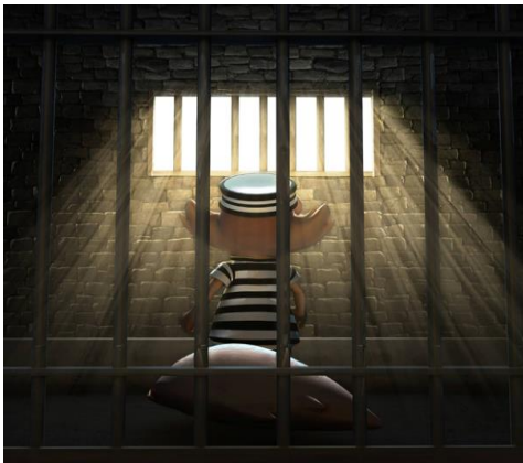
LES BARREAUX DE LA PRISON