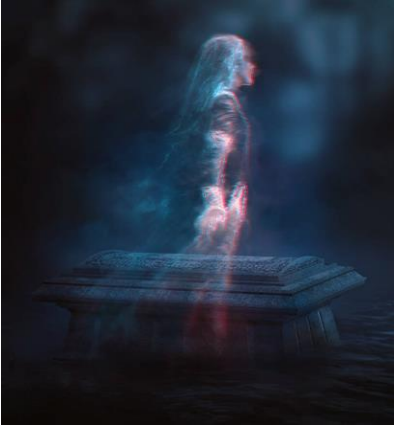
UN ESPRIT ERRANT