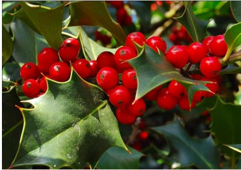
Un bouquet de houx vert