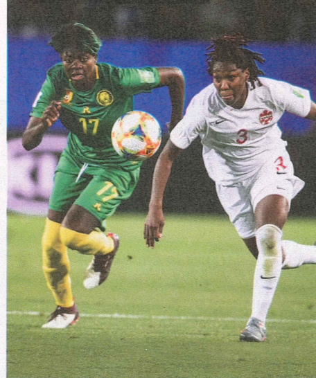
Gaëlle Enganamouit joue au poste d'attaquante.